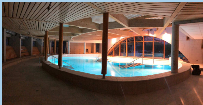
Nouvelle Piscine Panomarique

La mairie a commencé une étude sur ce problème chronique. Ce sujet doit faire l'objet d'un débat avant toute décision.